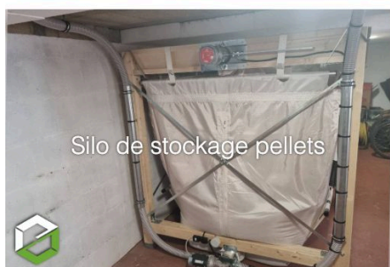
Silo de stockage pellets